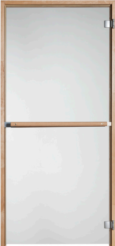
Kuva 3. Valmis asennus